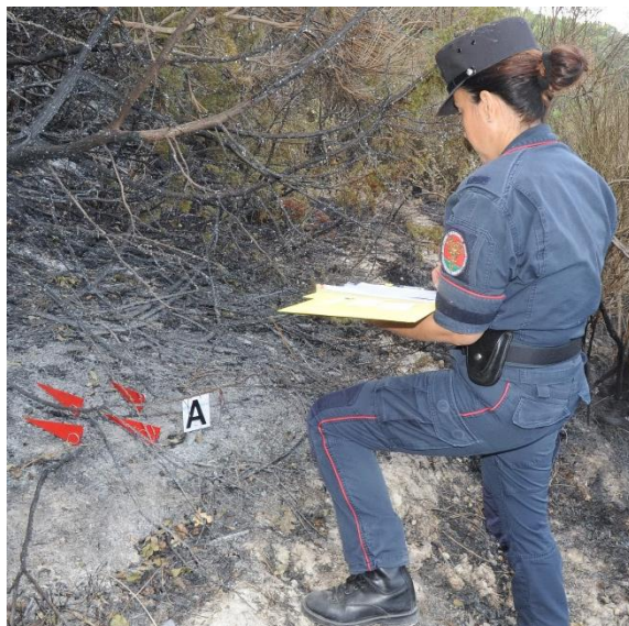
Carabiniere Forestale impegnato nelle fasi di repertazione con il Metodo delle Evidenze Fisiche (MEF), utilizzato per risalire al punto di origine dell'incendio.